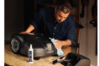
AUTOMOWER® WARTUNGS- UND REINIGUNGS-KIT 590 85 51-01