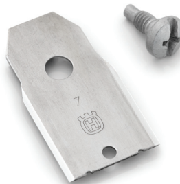
HUSQVARNA AUTOMOWER® ENHANCE HSS BLADES 599 80 53-01