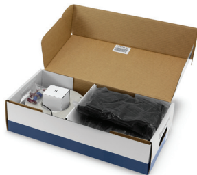
HUSQVARNA INSTALLATIONS-KIT S 967 97 21-01