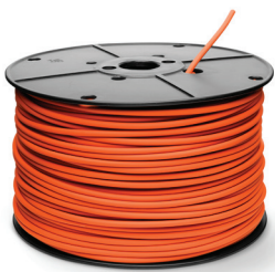
BEGRENZUNGSKABEL PRO Ø5,5MM 593 29 77-02