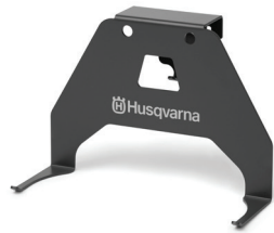
WANDHALTER AUTOMOWER 597 70 36-01