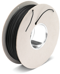
HUSQVARNA AUTOMOWER® BEGRENZUNGSKABEL STANDARD Ø2,7MM 580 66 20-06