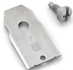
AUTOMOWER® ENHANCE HSS BLADES 599 80 53-02