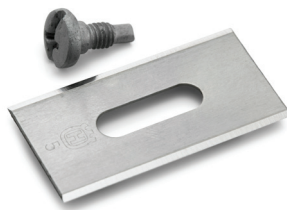
AUTOMOWER® ENDURANCE HSS BLADES 599 80 52-03