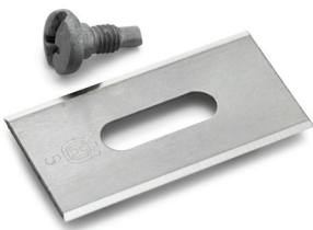
AUTOMOWER® ENDURANCE HSS BLADES 599 80 52-02