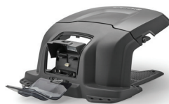
HUSQVARNA AUTOMOWER® GARAGE 305/310/315/315X/405X/415X 587 23 61-01