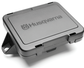
SCHUTZSTECKERHÜLLE 590 85 50-01