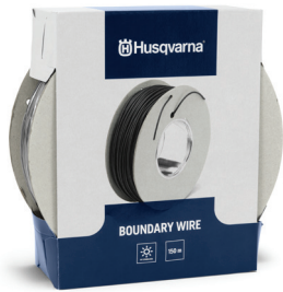
HUSQVARNA AUTOMOWER® BEGRENZUNGSKABEL STANDARD Ø2,7MM 597 23 78-01