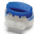
KABELVERBINDER 501 98 02-03