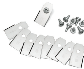
MESSER MIT ZWEI SCHNEIDEN 0,60 MM, KARBON, 9 ST. 577 86 46-03