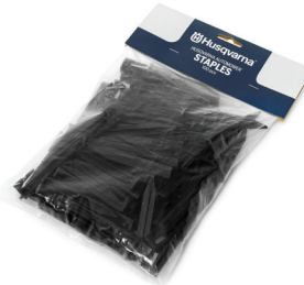
HUSQVARNA AUTOMOWER® BODENHAKEN 577 86 42-01