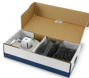
HUSQVARNA INSTALLATIONS-KIT M 967 97 22-01