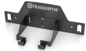
HUSQVARNA AUTOMOWER® WANDHALTERUNG 585 01 97-02