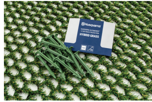
HUSQVARNA HYBRID-GRAS KIT 598 89 60-01