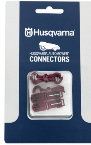
KLEMME FÜR ANSCHLUSS AN LADESTATION 577 86 48-01