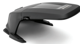
AUTOMOWER® GARAGE 597 63 53-01