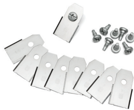
MESSER MIT ZWEI SCHNEIDEN 0,60 MM, KARBON, 300 ST. 577 60 66-04