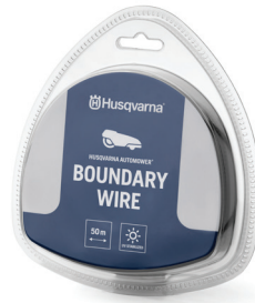
HUSQVARNA AUTOMOWER® BEGRENZUNGSKABEL STANDARD Ø2,7MM 597 23 78-02