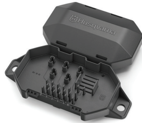
AUTOMOWER® CONNECTOR PROTECTION BOX 599 80 17-01