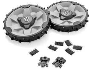
OFFROAD-KIT AUTOMOWER® 305 597 70 54-01