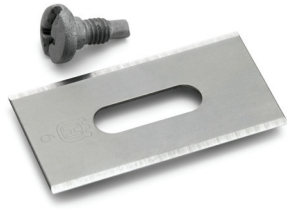
AUTOMOWER® ENDURANCE KLINGEN 595 08 44-03