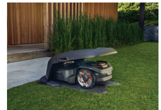
AUTOMOWER® GARAGE 536 66 41-01