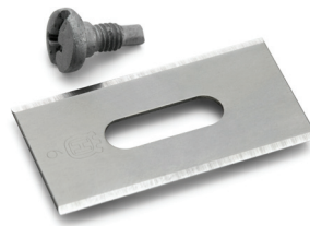
AUTOMOWER® ENDURANCE KLINGEN 595 08 44-01