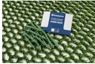
HUSQVARNA AUTOMOWER® HYBRID-GRAS KIT 598 89 60-02