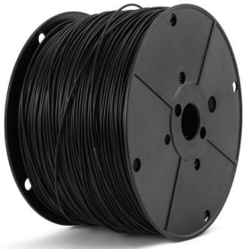
HUSQVARNA AUTOMOWER® BEGRENZUNGSKABEL STANDARD Ø2,7MM 580 66 20-09