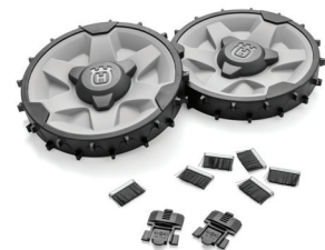
OFFROAD-KIT 420/430X/450X INKL. BÜRSTEN 581 88 97-02