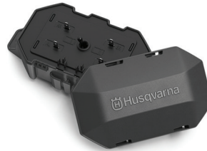
HUSQVARNA AUTOMOWER® AREA SWITCH 529 45 97-01