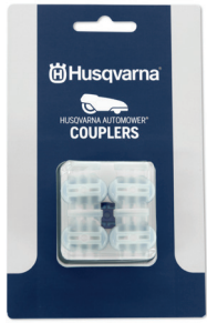
KABELVERBINDER 577 86 47-01