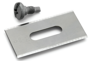
AUTOMOWER® ENDURANCE KLINGEN 595 08 44-02