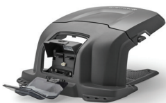
AUTOMOWER® GARAGE 420/430X/440/450X/520/550 585 01 94-01