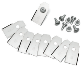
MESSER MIT ZWEI SCHNEIDEN 0,60 MM, KARBON, 45 ST. 577 60 65-05