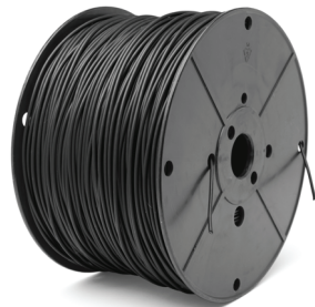
HUSQVARNA AUTOMOWER® BEGRENZUNGSKABEL HEAVY DUTY Ø3,4MM - 500 M 522 91 41-02