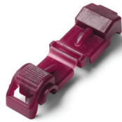
ANSCHLUSSKLEMME (1 ST.) 535 12 90-01