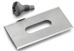
HUSQVARNA AUTOMOWER® ENDURANCE KLINGEN 599 80 52-01