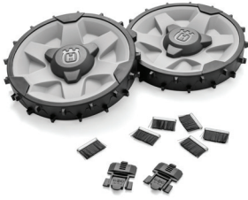
OFFROAD-KIT 310/315 INKL. BÜRSTEN 587 23 53-01