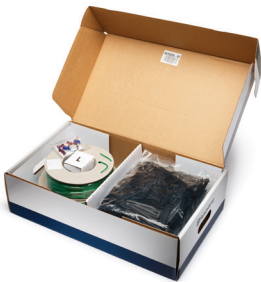
INSTALLATIONS-KIT L 967 62 36-03