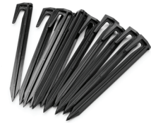
KLAMMERN KUNSTSTOFF 583 97 34-01