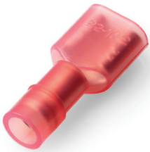
VERBINDER 529 28 08-01