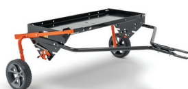
ANBAUPLATTFORM 586 63 72-01