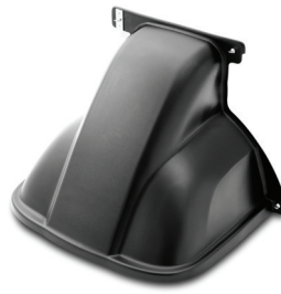
DEFLEKTOR FÜR TRAKTOREN MIT HECKAUSWURF 960 71 00-41