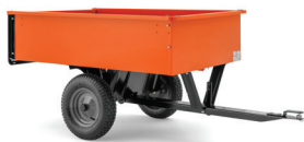
ANHÄNGER 275 501 00 82-01