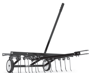
ENTMOOSER 586 63 66-01