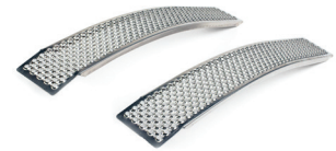
LADERAMPEN, GEBOGEN 505 69 90-41