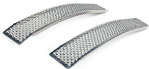
LADERAMPEN, GEBOGEN 505 69 90-43