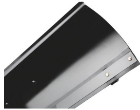
GUMMLEISTE 966 00 19-01