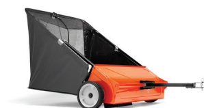
RASENKEHRMASCHINE 586 63 65-01