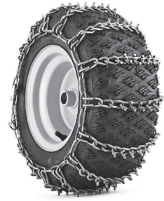
SCHNEEKETTEN MIT SPIKES - REIFENGRÖSSE 18 X 8,5-8" 964 99 43-01