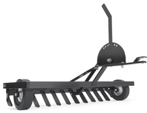
SCHOTTERHARKE 110CM 953 51 24-01