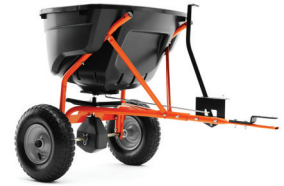
STREUWAGEN 75 967 02 72-01