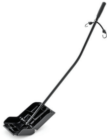
MULCHSTOPFEN FÜR TRAKTOREN MIT HECKAUSWURF 960 71 00-38