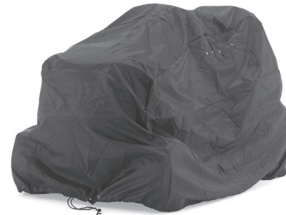
ABDECKUNGPLANE FÜR TRAKTOREN, GROSS 505 63 08-82