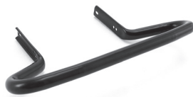
STOSSSTANGE FÜR TRAKTOREN 954 12 00-49