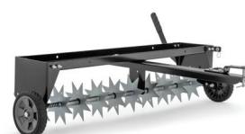
AERIFIZIERER 586 63 69-01