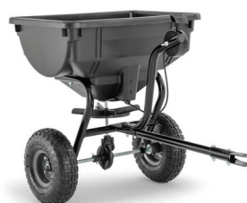
STREUWAGEN 30 589 40 93-01