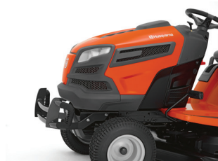
STOSSSTANGE FÜR TRAKTOREN 505 56 88-13