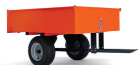
ANHÄNGER PROF1 953 51 17-02