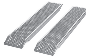
LADERAMPEN, GERADE 505 69 90-40