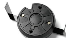
HECKGEWICHT 580 38 97-01